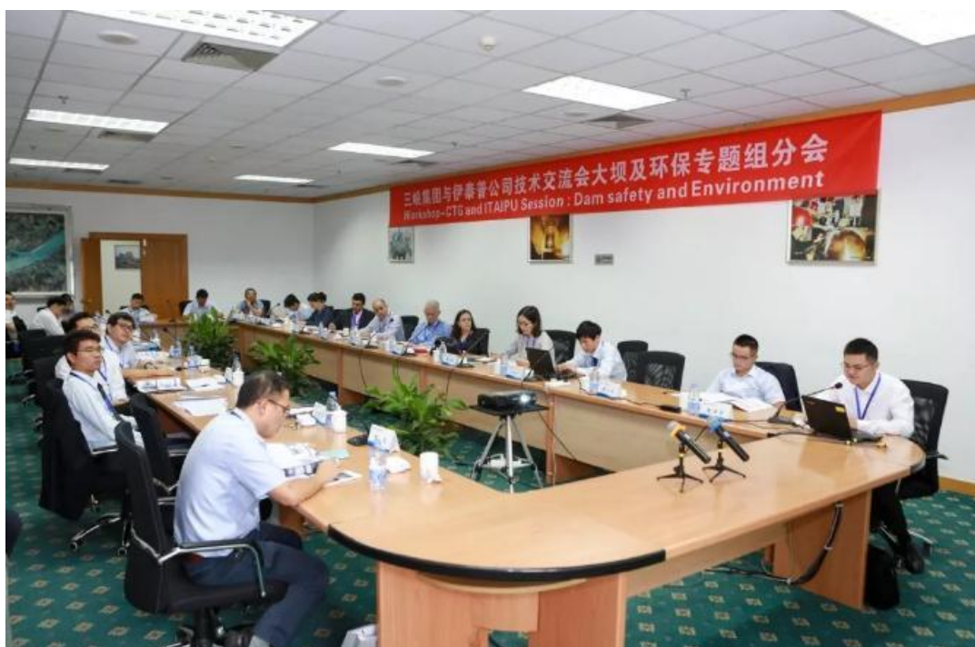
大坝及环保专题组分会场