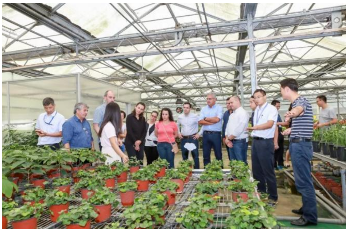
伊泰普公司技术专家考察珍稀植物基地