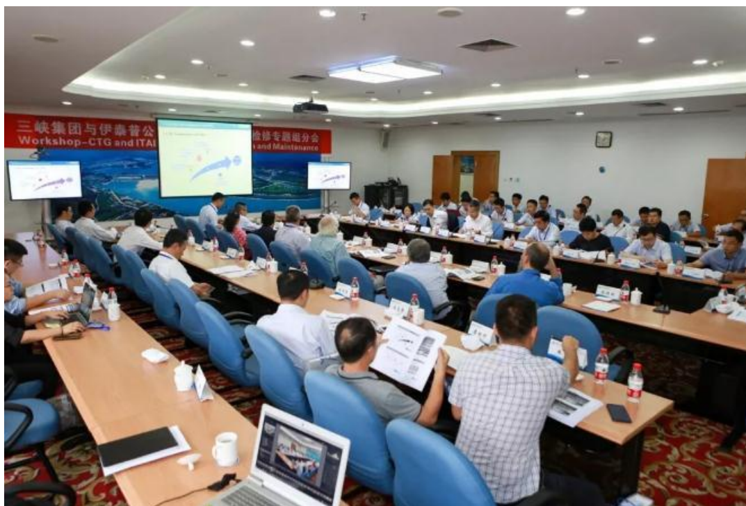
电站运行、设备检修专题分会场

会上，双方的技术专家分别介绍了三峡电站和伊泰普电站基本情况，两国电力市场和电站电力消纳情况，并围绕设备维修、大坝安全管理，电站运行、生态环保四个方面共 14 议题开展全面深入交流。